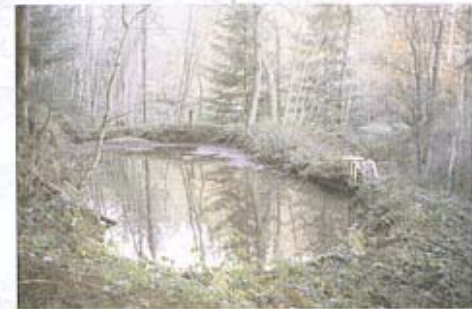
Vannes et écluses