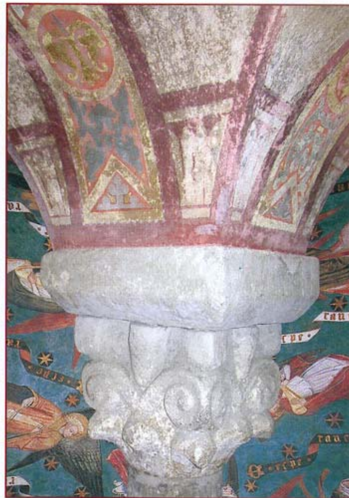
Textes : Valérie Estrade et Sandra Rainssant - Conception : Julien Faure - Impression : I.H.F.